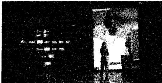
ROLLEMODELL: Nada har fanga inn ei kvinne som fyller livet sitt med å skrive. Kan ho vere ein rollemodell?