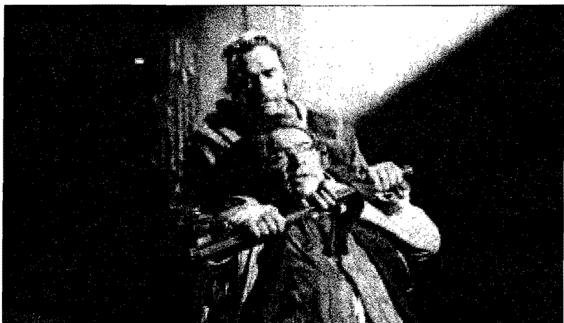
ANGEL OG AL: Dette er et mørkt og dypt pessimistisk stykke, skriver vår anmelder.