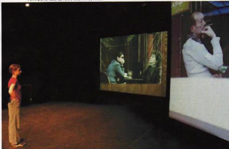
Káldor Edit Point Blank, Nada Gambler, fotó: Aknay Csaba